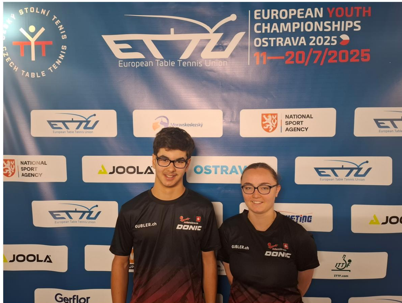
CEJ 2025 Ostrava, Tchéquie