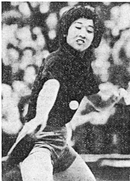
Qi Baoxiang, numéro 4 mondiale et présente lors de cette exhibition

Dans le cadre d'une tournée en Suisse romande qui l'a menée à Lausanne le 30 novembre puis à Neuchâtel le 4 décembre, l'armada chinoise a fait halte au bout du Lac pour cet événement exceptionnel et pour le plus grand plaisir des 800 spectateurs présents (il se dit même que certains attendaient dehors dans l'espoir de pouvoir entrer !).