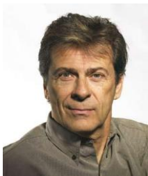
Rainer Kuschall, légende du tennis de table handisport suisse.

En effet, depuis les premiers Jeux paralympiques à Rome en 1960, ce ne sont pas moins de 31 médailles dont 14 en or que la Suisse a glané en tennis de table handisport, se classant 11e des nations les plus médaillées de l'histoire dans la discipline. On notera même que notre pays compte l'un des athlètes paralympiques les plus médaillés de l'histoire, à savoir Rainer Kuschall qui a remporté six médailles dont trois en or entre 1972 et 1984.