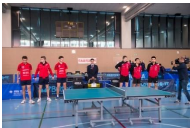
Les joueurs du ZZ-Lancy et de Rio-Star Muttenz avant leur rencontre.

C'est donc le 28 octobre 2017 à la salle omnisports de l'ECCG Aimée-Stitelmann à Plan-les-Ouates et sur les coups des 14h30 que pour la première fois de l'histoire, les quatre rencontres de LNA se disputent au même endroit et simultanément ! Hors championnats suisses élite, c'est aussi la première fois que l'on peut admirer les meilleurs joueurs du pays, avec six des dix meilleurs classés en Suisse. Au menu du jour : UGS-Chênois - Lugano, Meyrin - Wil, ZZ-Lancy - Rio-Star Muttenz et Veyrier - Kloten.