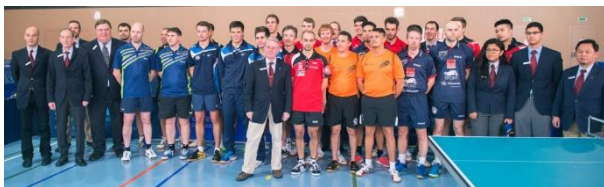
Les joueurs et les arbitres de cette troisième journée de LNA 2017-2018

Un succès sans précédent qui n'aurait pas été possible sans les bénévoles, l'accord des différents clubs et sans les arbitres, qui étaient huit sur cette journée et qui ont fait de cette journée un moment spécial pour notre magnifique sport !