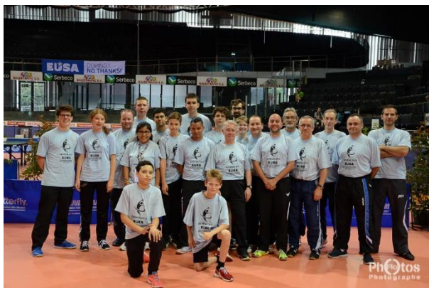
Les arbitres de ces 7èmes Championnats d'Europe Universitaires.

Ce ne sont pas moins de 24 universités provenant de 14 pays qui étaient déjà présentes à Genève le vendredi 19 juin et ont pu ainsi découvrir les installations et aménagements aux Vernets, spécialement mis à disposition gracieusement par la Ville de Genève afin de permettre les meilleures conditions de jeu aux joueurs et joueuses, pour qui la compétition débutait le lendemain avec les épreuves féminines et masculines par équipes.